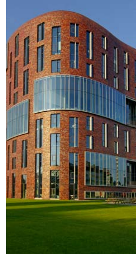
Amstel Academie VUmc waar de opleiding verzorgd wordt

Naast de opleiding tot anesthesiemedewerker is er ook een opleiding operatieassistent. De operatieassistent is een volwaardig lid van een team met een veelheid aan taken. Zo zorg je voor de voorbereiding van de operatie en zet je alle instrumenten klaar die tijdens de operatie gebruikt zouden kunnen worden. Tijdens de operatie gebeurt er van alles en denk jij mee met de chirurg: wat gaat er gebeuren, welke instrumenten zijn nodig? Ook als er dingen gebeuren die niemand had verwacht; je moet dan een sterk gestel en stalen zenuwen hebben. Aan het eind van de operatie ben jij nog lang niet klaar. Is er niks achtergebleven, gaasjes of instru-