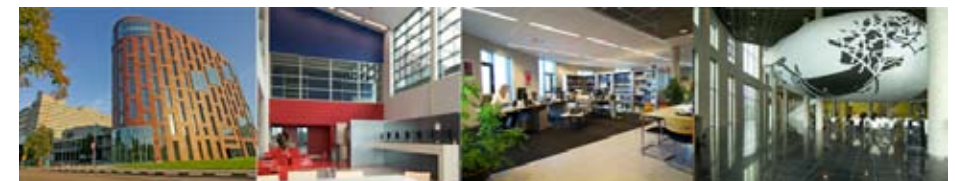
Amstel Academie VUmc

Het is mogelijk om losse leereenheden als bijscholing te volgen.