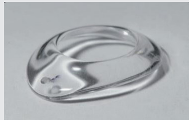
Figuur 1: Kunststof implantaat. Figuur 2: Plastic schaal tje.