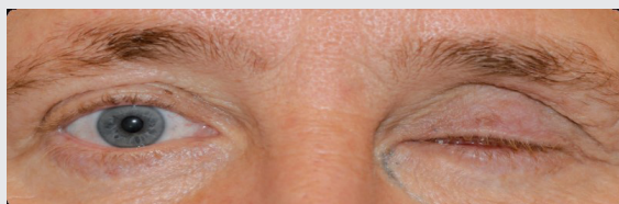
Figuur 4: Het geopereerde oog zit doorgaans dicht als er nog geen oogprothese in zit.