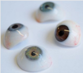
Figuur 6: Verschillende oogprothesen.