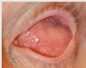
Figuur 5: Bij het openen van het oog is een met slijmvlies bedekte ruimte zichtbaar.