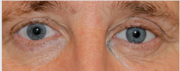
Figuur 7: Een oogprothese.